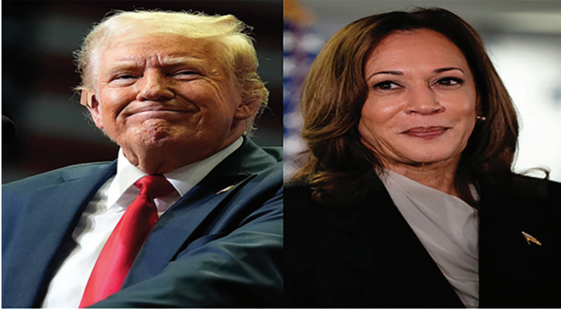
Former President Donald Trump and Vice President Kamala Harris.

The last few weeks have been like a bad, politically themed novella. First was the ill-fated presidential debate, President Biden vs. President Trump. That night would later prove to be the final nail in President Biden's Coffin, but not before a horrifying assassination attempt on Donald Trump. How the heck did we get here? Let's take a quick look back.